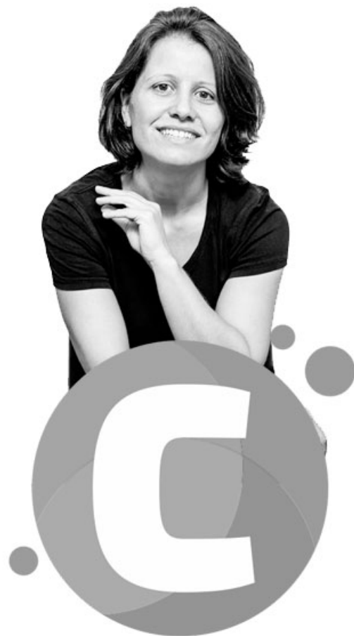
Diretora mídias e publicidade online