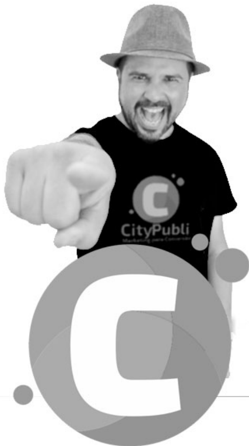
Diretor comercial e desenvolvimento web